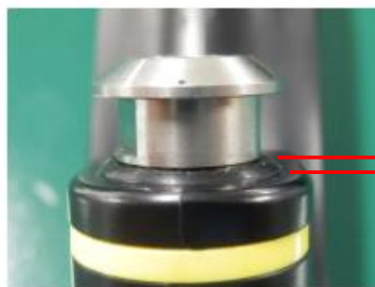
図3 ゴム部材が操作部から浮いている状態