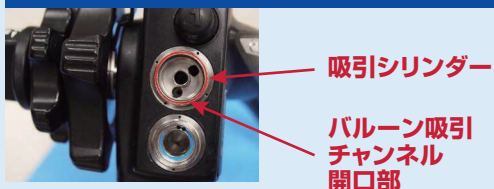
例5:GF-UE260-AL5 (消化管用超音波内視鏡)