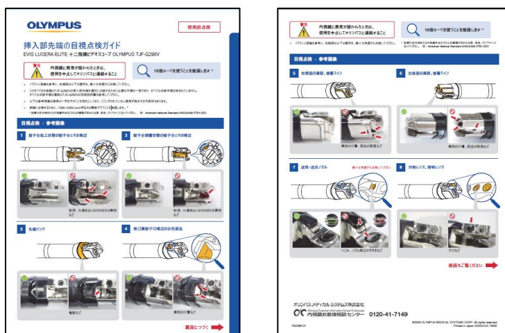
図2：挿入部先端の目視点検ガイド

挿入部先端の異物や破損などを点検いただくためのガイド資材を新たに作成。（図2 参照）